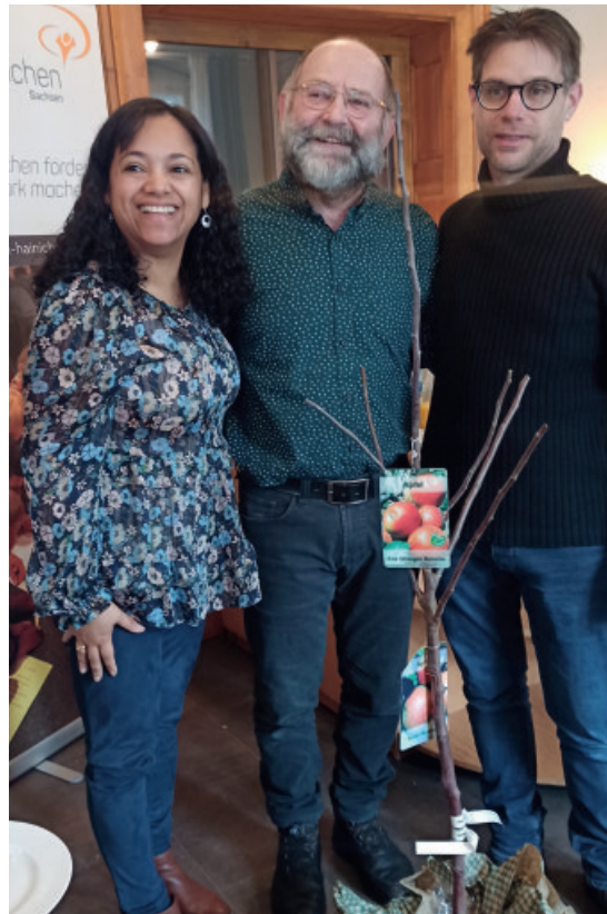
30 Jahre Jugend mit einer Mission in Hainichen