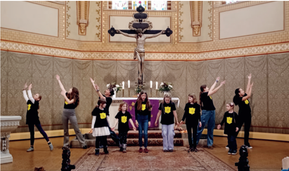
Viel Freude bereitete die Familienkirche am 17. März mit der JMEM - Tanzgruppe.