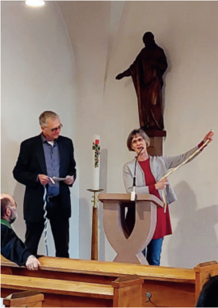
Segnungsgottesdienst im Rahmen der Mariengeweeek in der katholischen Kirche