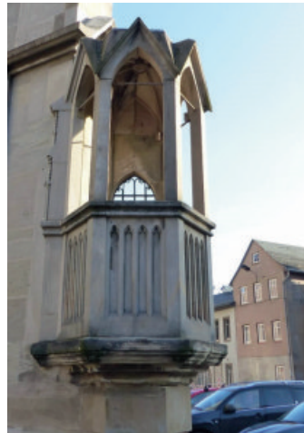
Außenkanzel der Johanniskirche in Saalfeld