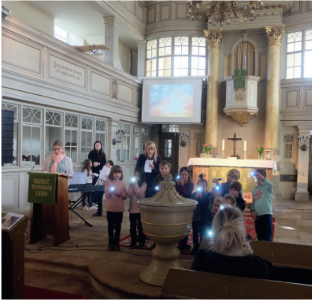
Familienkirche in Pappendorf am 18. Februar